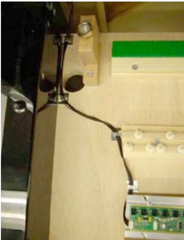
(5) Câble plat pour raccordement du rail des capteurs