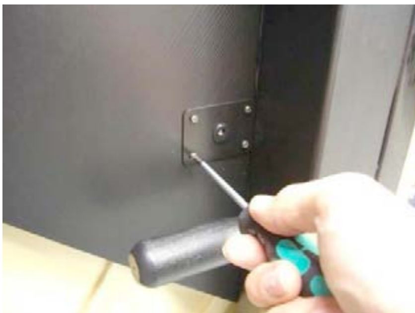
2) Plaque ou équerre de branchement DC