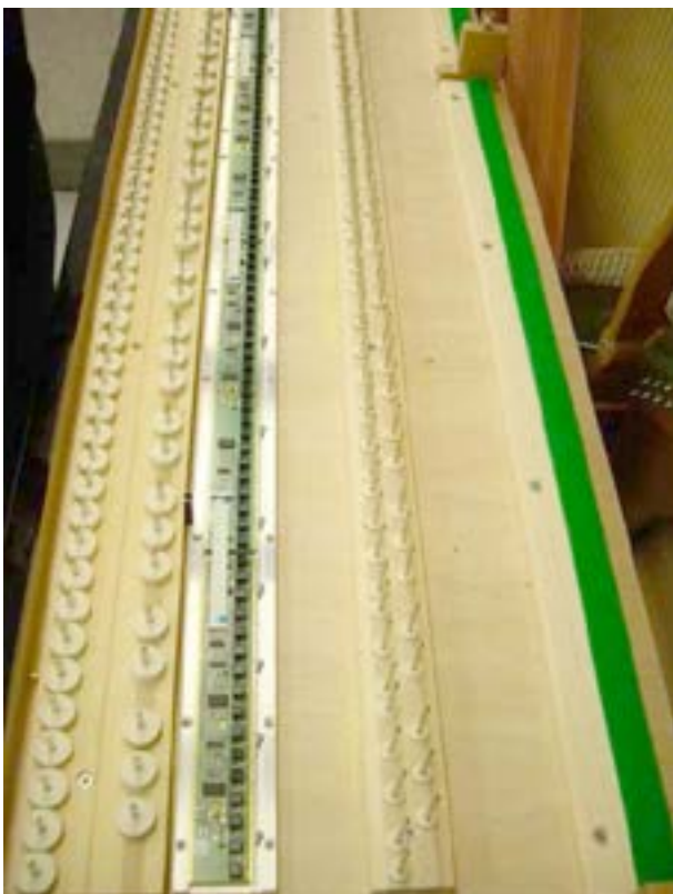
(4) Klaviatur-Sensorikleiste inkl. aller Abstandshalter und Schrauben(!)