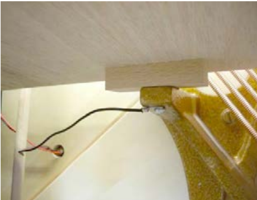
(3) Falls vorhanden, das Masse-Kabel mit Befestigung