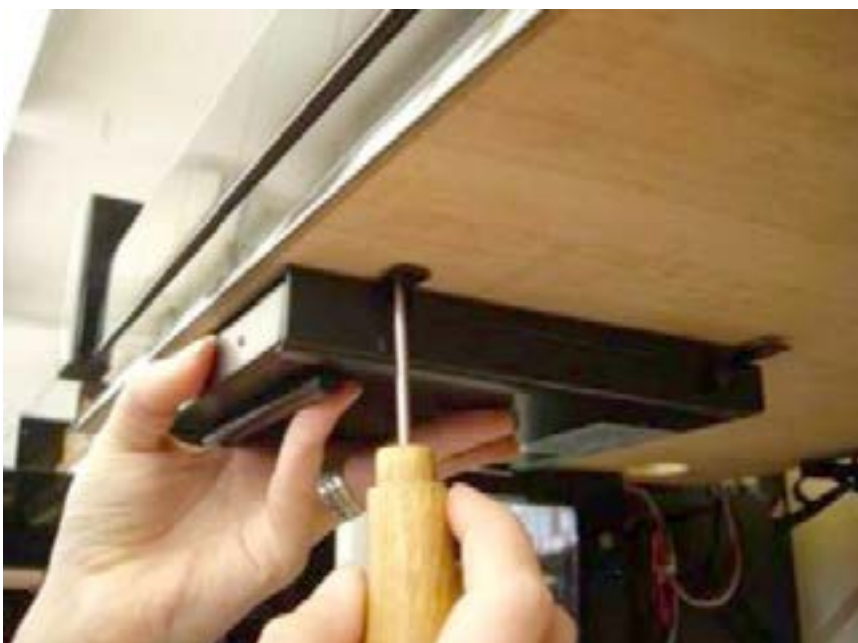
(7) Steuergerät mit Touchscreen (im Schubladengehäuse, befestigt mit 4 Schrauben, Kreuzschlitz)

Beachten Sie: es ist unbedingt erforderlich, das neue Netzteil (19V) zum VARIO duet UND die neue DC-Anschlussplatte zu verwenden!