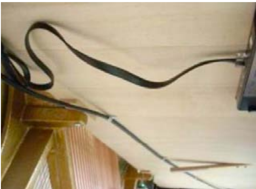
(6) Anschlusskabel zum Steuergerät