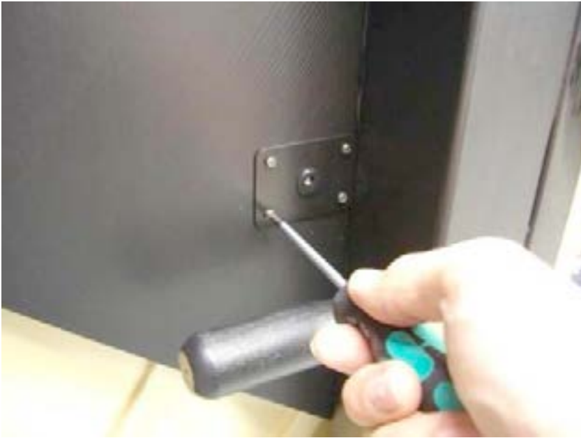
2) DC-Anschlussblech bzw. -Winkel